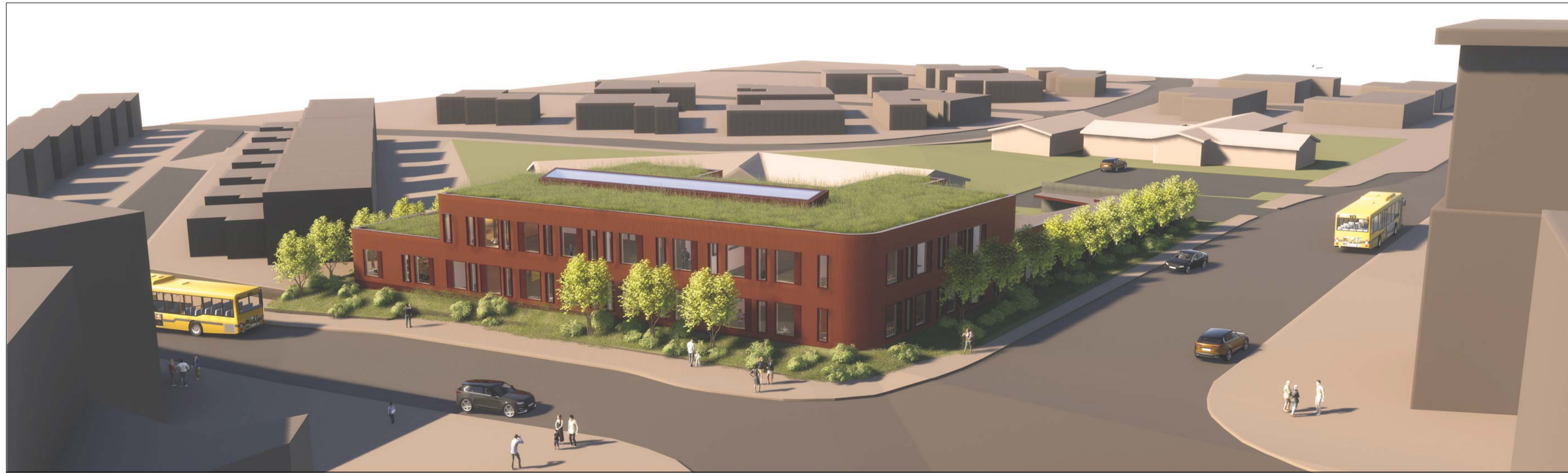
SKÝRINGARMYND: YFIRLITSMYND FRÁ NESVEGI/SÚÐURSTRÖND