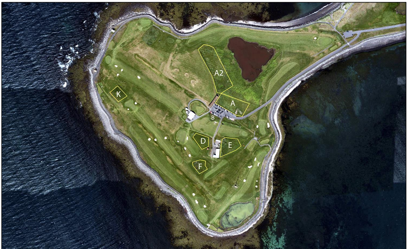
4. mynd. Kríuvörp í Suðurnesi sumarið 2021. Loftmynd af vef Seltjarnarnesbæjar.