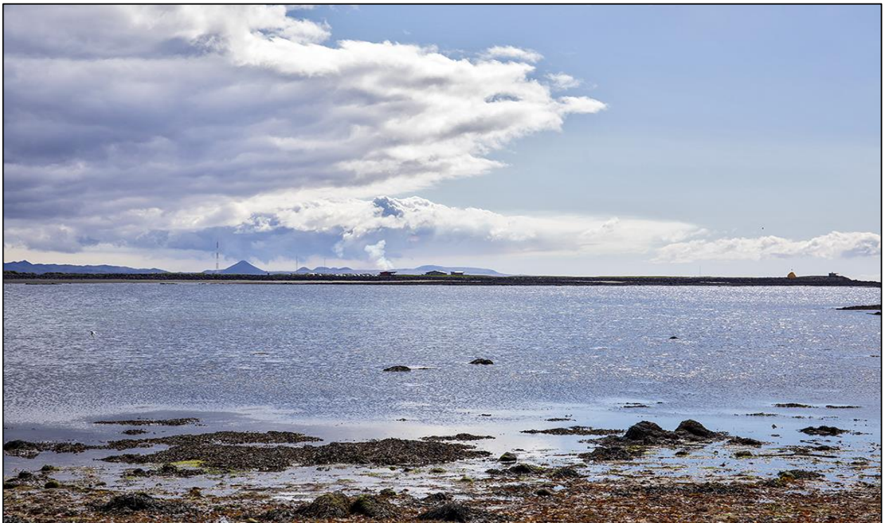
11. mynd. Seltjörn frá Gróttu 14. júní 2021. Gosið í Fagradalsfjalli í baksýn.