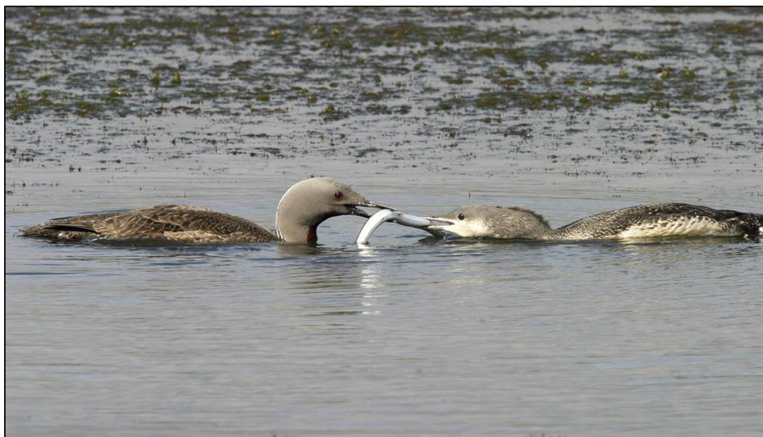
2. mynd. Lómur fæðir stálpaðan unga. Lómur hefur að öllum líkindum orpið í Dal í Suðurnesi í ár. Myndin er tekin í Friðlandinu í Flóa. Ljós. JÓH.