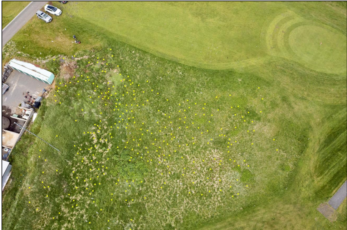
7. mynd. Kríuvarp E þann 14. júní 2021. Hreiðrin eru sýnd með gulum doppum. Þau voru 347 á þessu svæði.