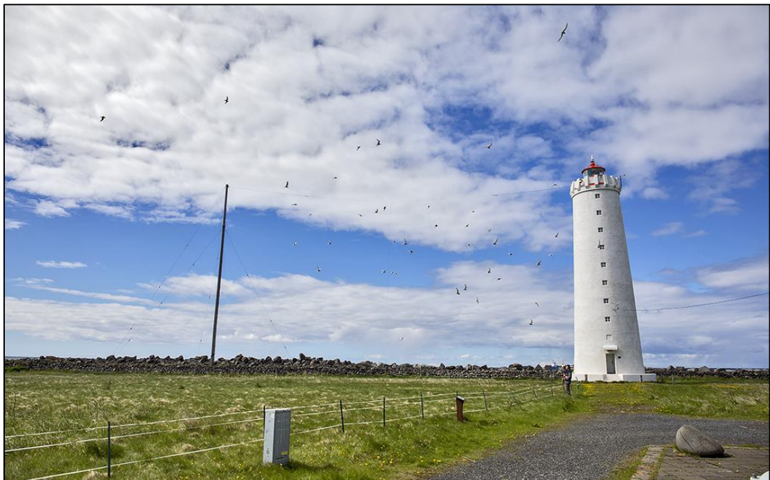
1. mynd. Kríuvarpið í Gróttu 2021. Það var á smábletti uppið húsinn, aðeins um 35 hreiður. Þetta er sterk vísending um afrán minks. 14. júní 2021.