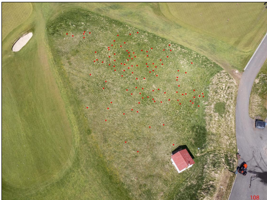
6. mynd. Kríuvarp D 14. júní 2021. Hreiðrin 118 eru sýnd með rauðum doppum.