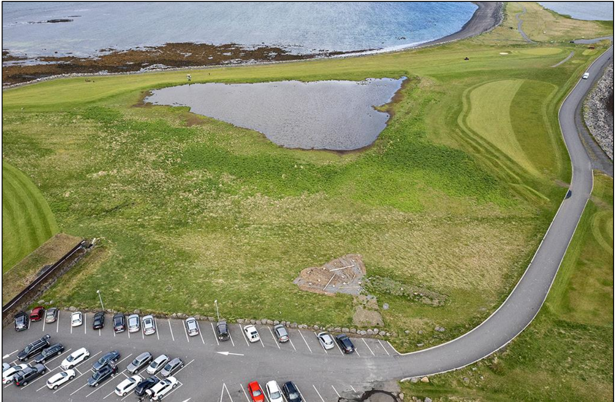
10. mynd. Dalur í Suðurnesi. Þar er afar mikilvægt varpsvæði fyrir marga fugla, kríur, endur, gæsir og mófugla. Malarbletturinn sem settur er út fyrir kríuna, sést vel á miðri mynd. Varpið er hvergi þéttara og kríunum finnst gott að sitja á mölinni og safnast þær þar gjarnan saman. Ljós. JÓH 14. júní 2021.