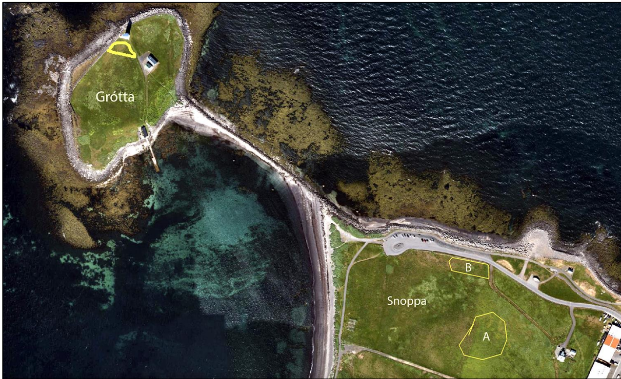
5. mynd. Kríuvörp á Snoppu og í Gróttu. Loftmynd af vef Seltjarnarnesbæjar.