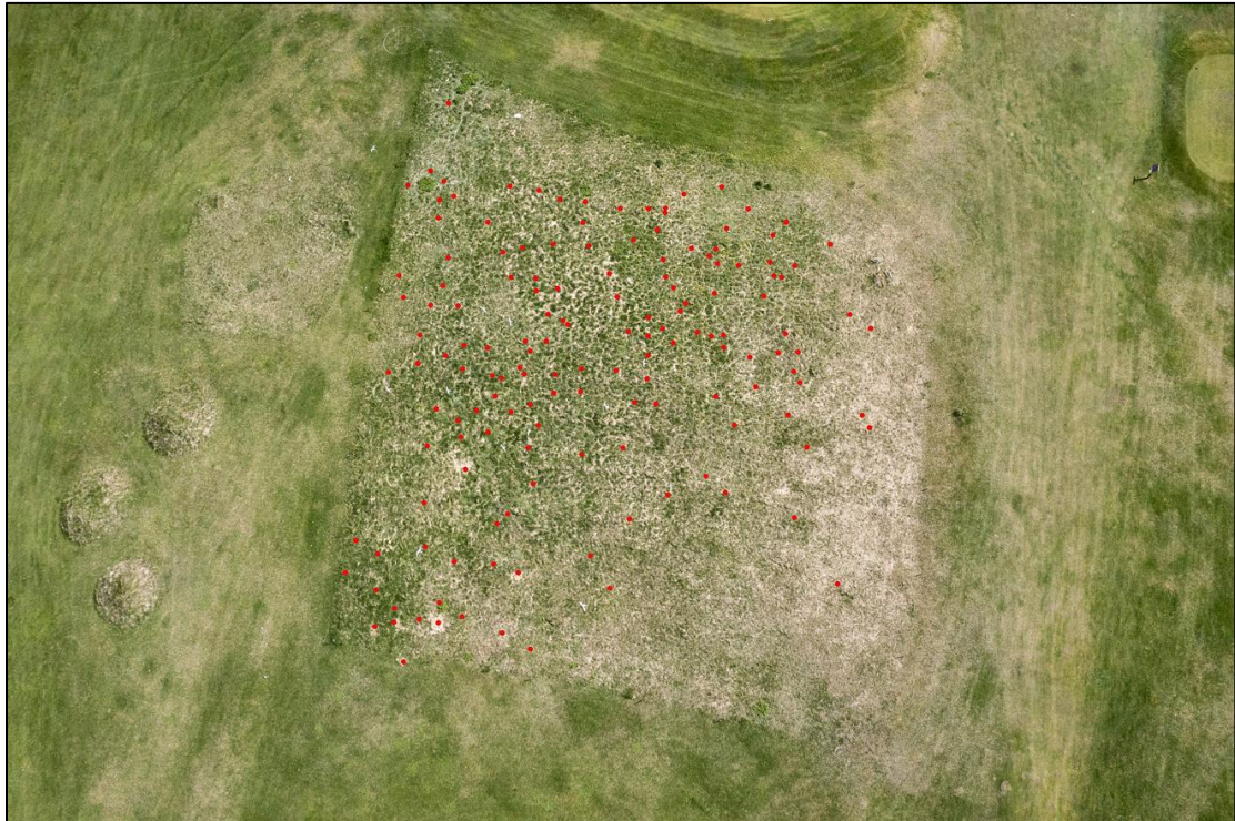
9. mynd. Krúvarp K 14. júní 2021. Hreiðrin eru sýnd með rauðum doppum, þau voru 152 á þessum bletti.