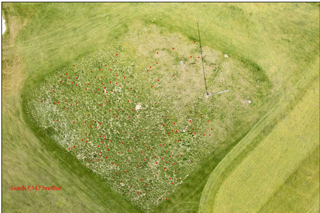
8. mynd. Kríuvarp F 14. júní 2021. Hreiðrin 147 eru sýnd með rauðum doppum.