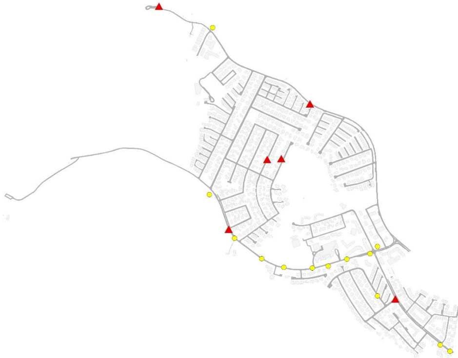
Mynd 2.2 Slys á Seltjarnarnesi árin 2012-2016. Gulir hringir eru slys með litlum meiðslum og rauðir þríhyrningar slys með alvarlegum meiðslum.

Flest slys með litlum meiðslum gerast á og við Suðurströnd. Algengasta orsök slysa með meiðslum (litlum og alvarlegum) er slæm færð, ökutæki og hjólbarðar í ólagi, og mannlegar orsakir.