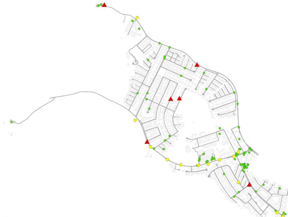
Mynd 2.1 Óhöpp og slys á Seltjarnarnesi árin 2012-2016. Grænir hringir eru óhöpp, gulir hringir slys með litlum meiðslum og rauðir þríhyrningar slys með alvarlegum meiðslum.

Staðsetningar óhappa og slysa á Seltjarnarnesi árin 2012-2016 má sjá á mynd 2.1. Tilvikin eru litagreind eftir alvarleika þeirra.