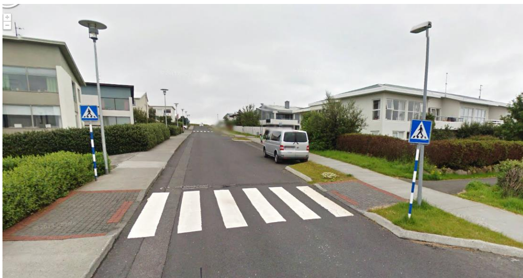
Mynd 3.1 Gangbraut með tvö gangbrautarskilti, þrengingu, niðurtekt og blindrarönd.

Við gangbrautir sem eru sebramerktar skal vera eitt skilti hvoru megin gangbrautarinnar, líkt og sýnt er á mynd 3.1. Til að tryggja aðgengi fyrir alla skal koma fyrir niðurtekt og blindrarönd í gangstéttarkanti þar sem gangbrautir/göngupveranir eru.