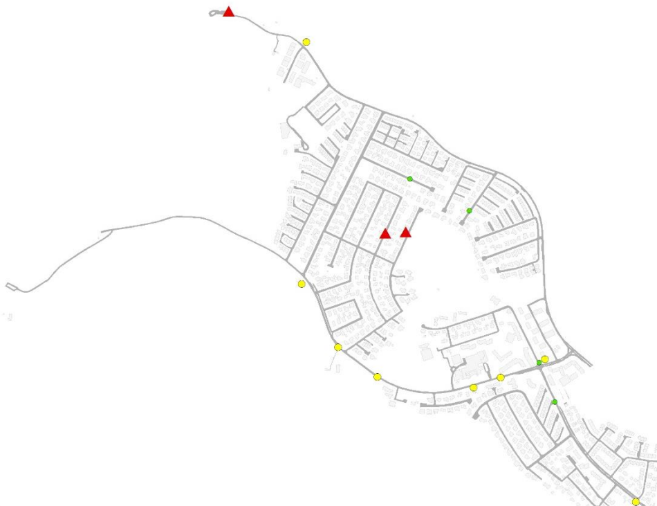
Mynd 2.3 Óhöpp og slys á óvörðum vegfarendum á Seltjarnarnesi árin 2012-2016. Grænir hringir eru óhöpp, gulir hringir slys með litlum meiðslum og rauðir þríhyrningar slys með alvarlegum meiðslum.

Tæplega 62% slysa með litlum meiðslum og 50% slysa með alvarlegum meiðslum verða á óvörðum vegfarendum, það er fótgangandi og hjólríðafólki. Slysum með meiðslum á óvörðum vegfarendum hefur farið fjölgandi en árin 2007-2011 urðu tvö slys á óvörðum vegfarendum en árin 2012-2016 urðu tólf slys á óvörðum vegfarendum. Á mynd 2.3 eru sýnd óhöpp og slys á óvörðum vegfarendum árin 2012-2016.